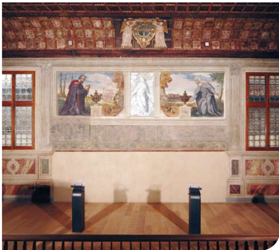
Un'immagine della scuola della Carità da poco restaurata

Proprio per questo trenta nuovi volontari si sono aggiunti al già numeroso gruppo Salvalarte di Legambiente per garantire i turni di apertura dei monumenti altrimenti chiusi al pubblico.