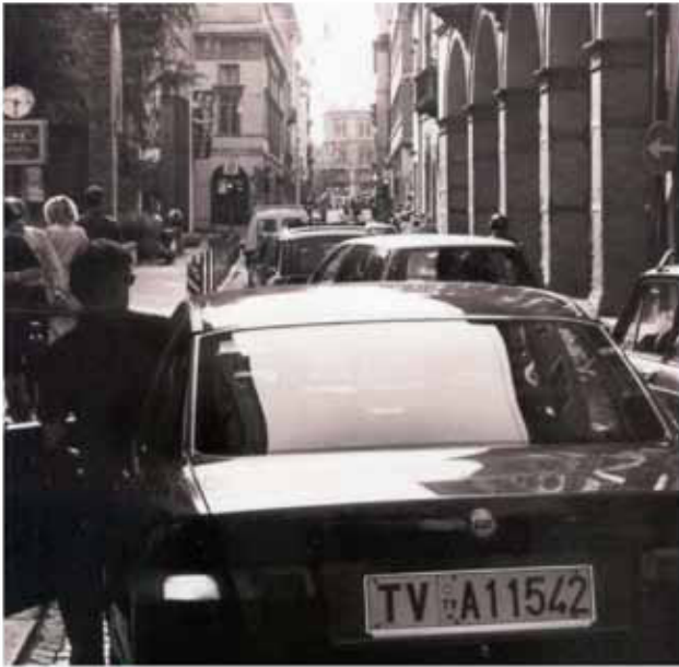
Via S. Francesco: anni '90