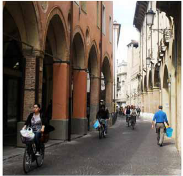
Via S. Francesco: oggi