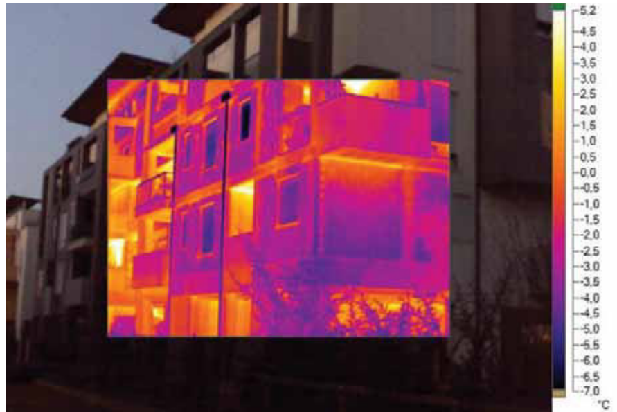
Residence IRIS – visione generale - sono chiaramente visibili i ponti termici delle finestre e dei solai

L'analisi termografica consente anche di individuare dove agire nella ristrutturazione dei vecchi condomini. L'analisi qui sotto si è concentrata sul complesso INPDAP di via Palestro –