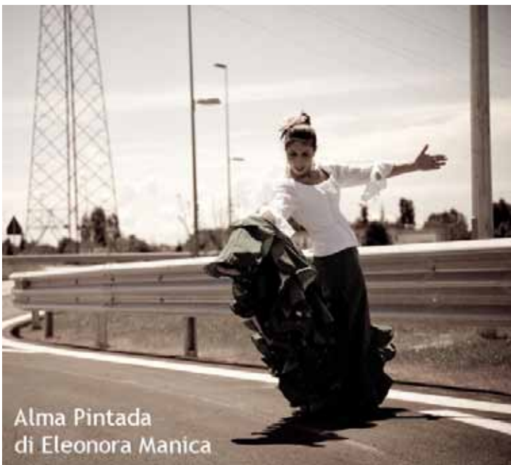
Alma Pintada di Eleonora Manica