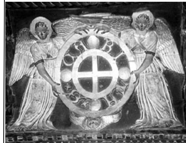
Escudo de la Escuela de la Caridad