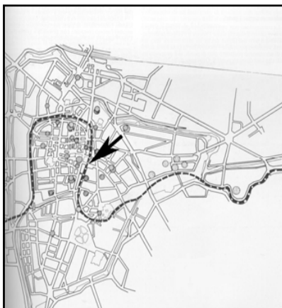
Le cours du Bacchiglione dans la ville de Padoue avant les remblais des années '60.