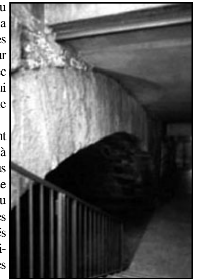
Vue actuelle de l'arcade du pont

Les parapets étaient probablement réalisés en pierre et revêtus avec des plaques de marbre de Carrare comme le montre la plaque avec l'inscription