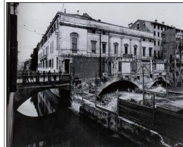
Le Pont St Laurent pendant les fouilles du (palais du)

Passage souterrain le long de la rue San Francesco