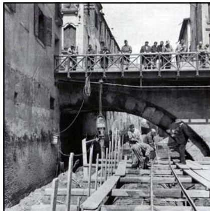
Le pont pendant le remblai du Naviglio

Le pont St. Laurent, en particulier, était situé au niveau de l'actuelle rue San Francesco (St François), dont le tracé pourrait calquer celui d'un decumanus d'importance vitale pour la circulation citoyenne.