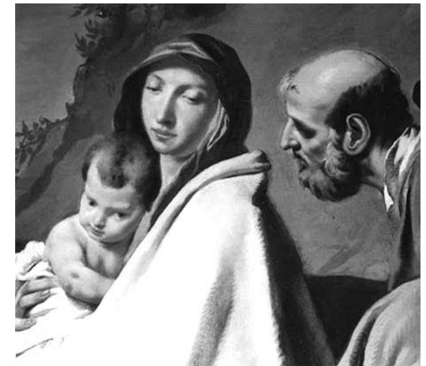
F. Polazzo, Huida a Egipto

En la Condena, al acacimiento principal se arriman otras escenas secundarias, mientras los personajes están representados con brío en el interior de la estructura horizontal de la tela; la pincelada parece nerviosa y el cromatismo rico.