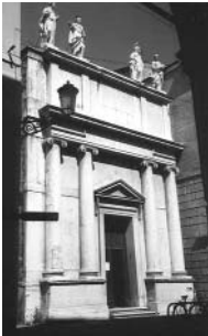
The facade of oratory

Pero este signo precursor del nuevo estilo no fue valorado en seguida así que, al construirse la iglesia, el mismo Temanza cuenta "del ruido que hizo el mezuino frayle". De hecho en aquella época tuvo que aparecer muy fría frente a las iglesias contemporáneas de la ciudad, todavía de estilo tardío barroco.