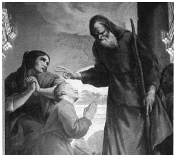
G. Nogari - San Francisco de Paola

Legambiente è l'associazione ambientalista più diffusa in Italia (1.000 gruppi locali, 110.000 tra membri e sostenitori). Organizza campagne per misurare e combattere l'inquinamento, attività di volontariato, iniziative per la tutela e la valorizzazione dell'ambiente e del patrimonio culturale.