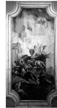
G. Anselmi Apoteosis de S. Margarita

En el presbiterio, el retablo presenta a Santa Margarita con la palmera del martirio calpes-