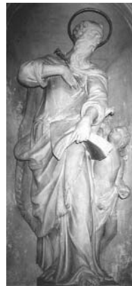
A. Bonazza, estatua de San Mateo

El santo, cuyo culto era muy difundido en el siglo XVIII, está representado mientras devuelve vista a un ciego. En los nichos al lado del altar se encuentran cuatro estatuas que representan a los Cuatro Evangelistas figuras expresivas que toman actitudes evidenciadas por los agraciados paños, en el estilo del Bonazza.