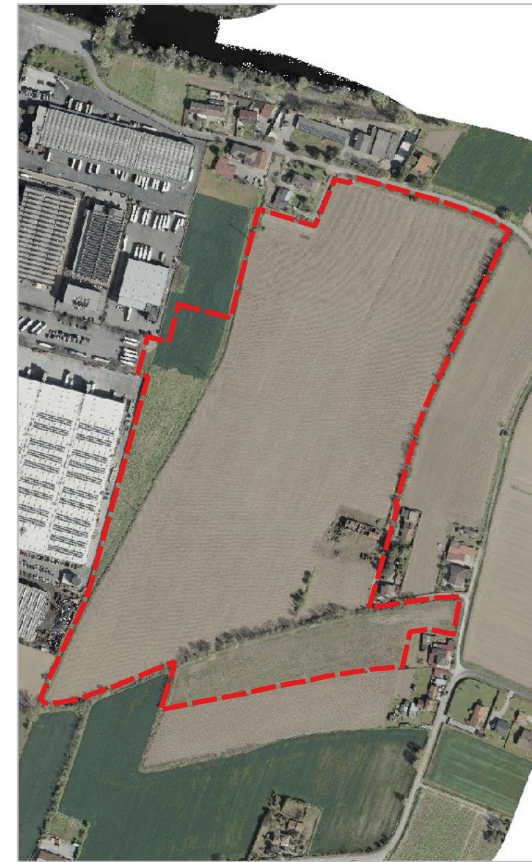
ESTRATTO ORTOFOTO anno 2023